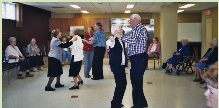
Les bénévoles dansent et chantent avec les clients de Viactive de Notre-Dame-des-Pins.

Un jour à la fois, ô mon Dieu Hier, n'est déjà plus là Je voudrais être une fée Et pouvoir combler Tous les esseulés Permetts qu'en ce jour Ô mon Dieu, je sème sur mon chemin La joie, la gaieté La paix, l'amitié Un jour à la fois.