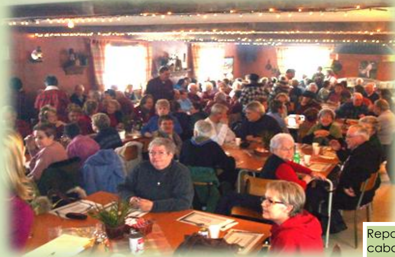
Repas reconnaissance à la cabane à sucre de St-Benoit où 145 bénévoles étaient présents !

L'ABBS aura à assurer la relève des membres du conseil d'administration (C.A.) dans les prochaines années. Les membres du C.A. sont des leaders positifs de leur milieu. Ils représentent la voix des différents bénévoles de leur localité. Les membres du C.A. sont des visionnaires qui connaissent les réalités et les besoins du milieu actuel et ces personnes sont également capables de se projeter dans l'avenir et d'estimer les futures nécessités et les moyens que l'ABBS devra disposer pour les combler à moyen et à long terme. Ces membres sont les porteurs et les représentants de la mission de notre organisme.